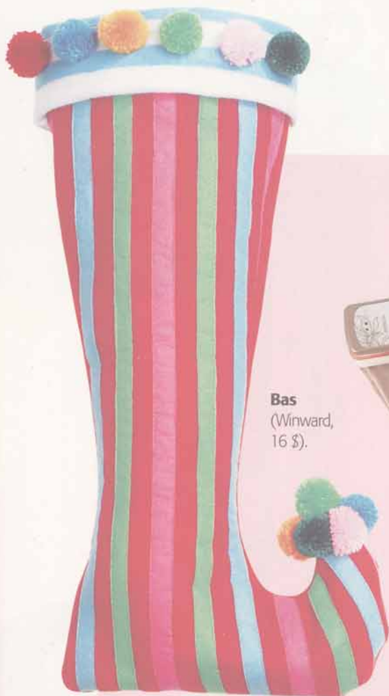
Bas (Winward, 16 $).