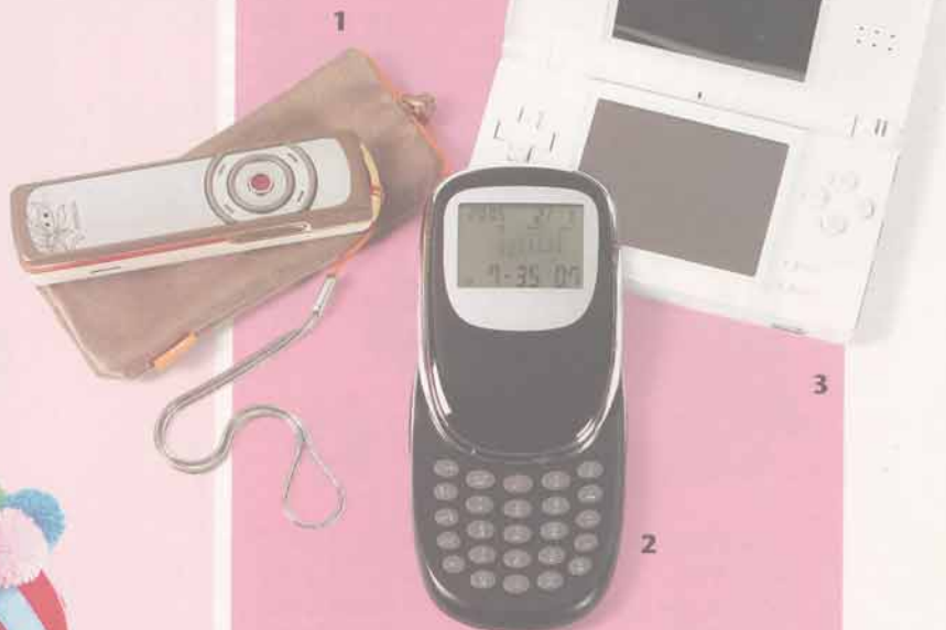
1. Cellulaire GSM 7380, avec miroir et appareil photo (Nokia, 775 $). 2. Calculatrice avec calendrier, horloge et convertisseur de monnaies (Addex Design, 9,99 $, chez Zone). 3. Console de jeu Nintendo DS, avec stylet (Nintendo, 149,95 $).