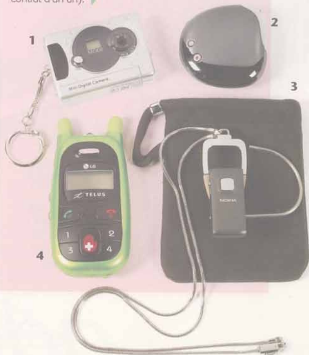
1. Mini-caméra numérique avec carte-mémoire de 16 Mo (39,99 $, chez Canadian Tire). 2. Mini-lecteur mp3 FM20, 512 Mo (LG, 129,99 $). 3. Écouteurs sans fil Bluetooth BH-800, pour cellulaire (Nokia, 189,95 $). 4. Cellulaire pour enfant Migo , capacité de 4 numéros de téléphone (LG, 99,99 $ ou 49,99 $ avec contrat d'un an).