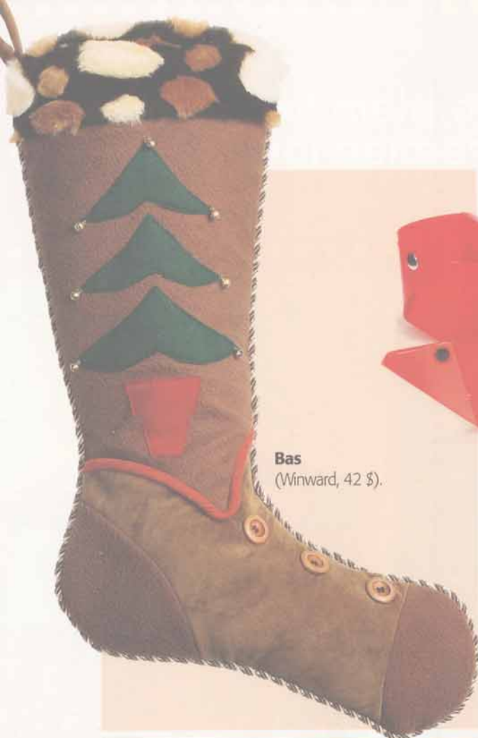
Bas (Winward, 42 $).