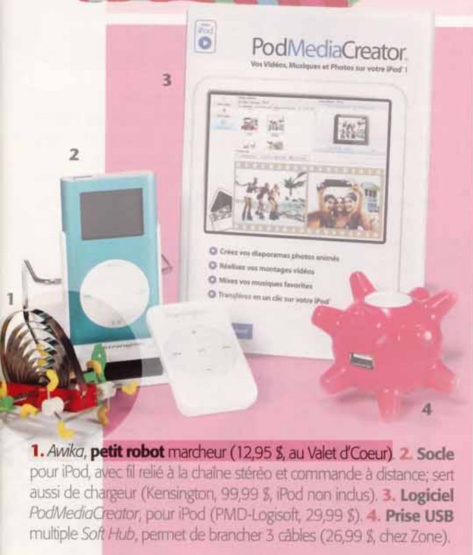
1. Awika, petit robot marcheur (12,95 $, au Valet d'Œur). 2. Socke pour iPod, avec fil relié à la chaîne stéréo et commande à distance; sert aussi de chargeur (Kensington, 99,99 $, iPod non inclus). 3. Logiciel PodMediaCreator , pour iPod (PMD-Logisoft, 29,99 $). 4. Prise USB multiple Soft Hub, permet de brancher 3 câbles (26,99 $, chez Zone).